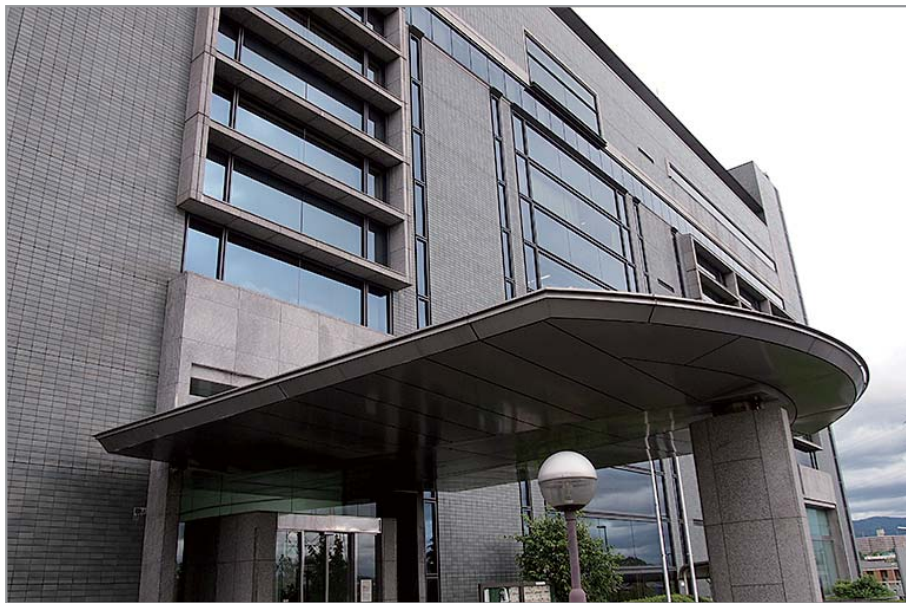
▲枚方市教育委員会(輝きプラザから)