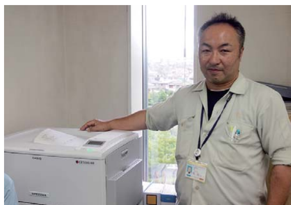
▲教育委員会に設置された『SPEEDIA GE5000-BR』

カシオ計算機ではこうした2色ページプリンタで校務の効率化やコストダウンを図るという新たな解決策を、今後さらに教育現場に向けて提案していく意向だ。